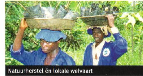
Natuurherstel én lokale welvaart

De opbrengst is genoeg om zoveel bos aan te planten als nodig is om de hoeveelheid uitgestoten CO 2 weer vast te leggen. In de praktijk vindt veiligheidshalve een ruime overcompensatie plaats - tot drie maal. Zo kunnen ook broeikas effecten van andere uitgestoten gassen zoveel mogelijk worden gecompenseerd. De berekeningen zijn gecontroleerd door het Rijksinstituut voor Volksgezondheid en Milieu (RIVM).