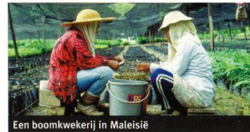
Een boomkwekerij in Maleisië

Neem contact op met Trees for Travel Stichting. Al uw zakenvluchten zijn dan voortaan CO 2 -gecompenseerd. Bovendien herstelt u de natuur en biedt u zinvolle werkgelegenheid in werelddelen die dat uitstekend kunnen gebruiken. Die kans wilt u toch niet laten lopen?